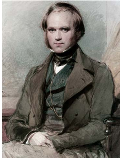
查尔斯·达尔文在小猎犬号上做南美洲海岸线相关调查时建立关于地质学以及大型哺乳类生物灭绝的理论

提出的这个假设被后人称为进化论。但达尔文一开始选择从地质学的角度在岩石中寻找地球存在了百万年的证据