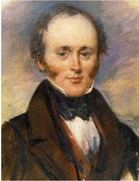
1840 年格拉斯哥英国组织会议上查尔斯莱尔 (图 亚历山大克雷格 来源 维基百科)

但这其实是“科学主义”，而非“科学”。这是一种信仰，一种世界观：它认为人类通过科学获取的知识可以或“终有一天”可以解答所有的问题。