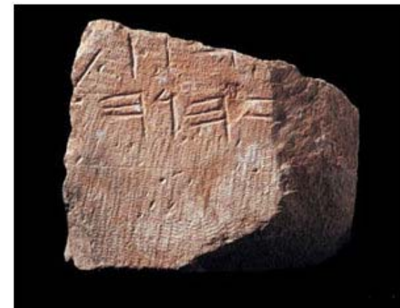
Paleo-Hebraico YHWH na pedra