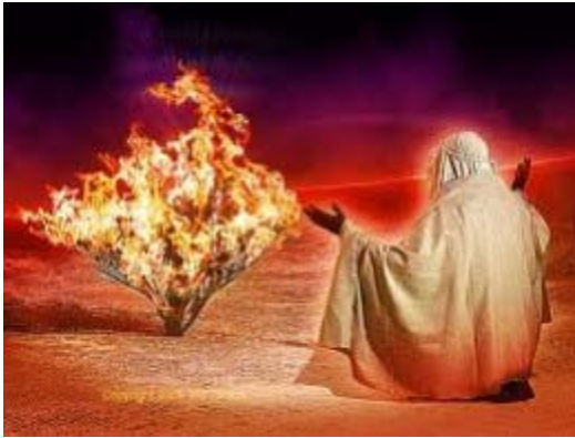
Moisés en la zarza ardiente

"Y DIOS dijo a moisés, YO SOY EL QUE SOY: y EL dijo, Así tú dirás a los hijos de Israel, YO SOY me ha enviado a ustedes." Éxodo 3:14